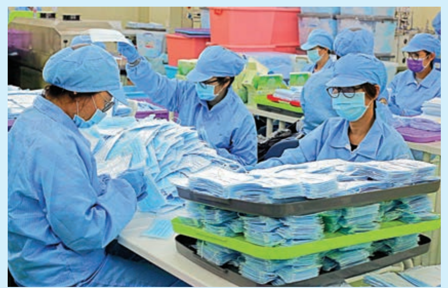
▲口罩工場聘請80多名員工，分三更24小時運作，可日產約20萬個口罩。圖為員工忙於將口罩分類及包裝