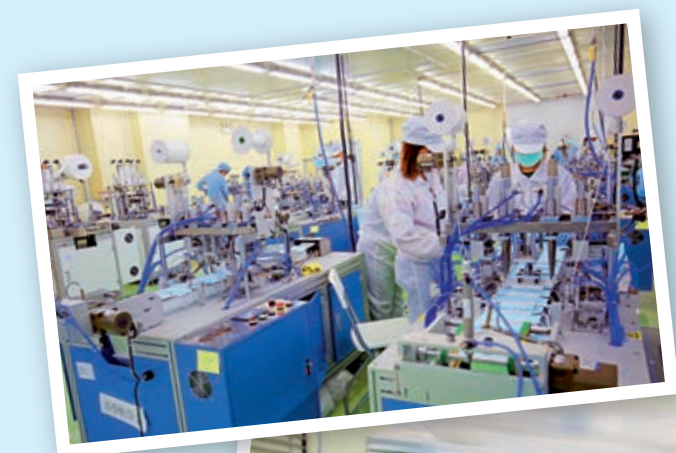
◀半自動生產機生產的口罩，需由員工訂上「耳仔繩」

政府預計所有生產線全面投產後，每月合共可向政府供應3455萬個口罩，另有815萬個口罩供應本地市場，即合計共有4270萬個口罩。