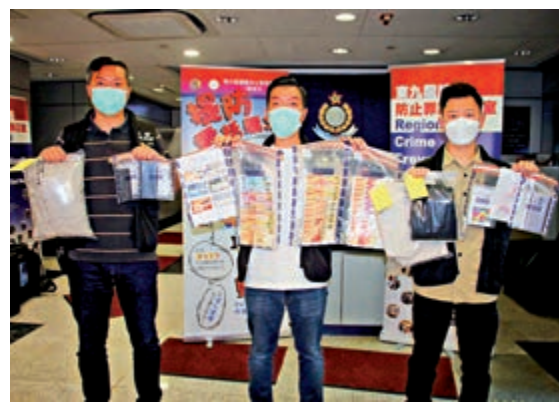
▲東九龍總區重案組揭破電話詐騙案拘三人，涉款680萬元

譚指出，本年首季電話騙案涉及騙取網上理財密碼個案，由上月開始增多，受害人大部分為長者，個別受騙金額較高。而該類案佔電話騙案約27%，涉及金額約4000萬元。警方呼籲市民，任何內地或本地執法部門均不會透過社交通訊軟件進行筆錄口供，如有任何疑問，市民應向警方求助。